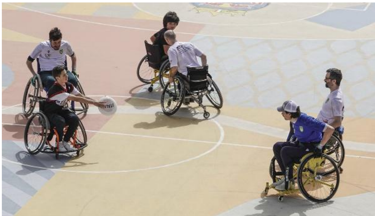
A Rimini la spiaggia è stata presa d'assalto nel weekend: tanti hanno seguito le gare del 'Paganello', il campionato di frisbee (foto a sinistra); non sono mancate le sfide sul campo di basket in piazzale Kennedy (foto a destra)