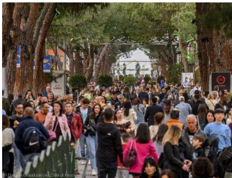
In alto turisti a pranzo in spiaggia a Rimini; sotto la folla in viale Ceccarini a Riccione

nuova collezione di Dsquared2, con i due stilisti accolti come vere star dalla folla che ha cinto d'assedio per ore la boutique Gaudenzi in viale Ceccarini. Vip, modelli, una fauna eclettica di personaggi che all'ora dell'aperitivo si è accalata davanti ai cordoni sorvegliati dai buttafuori. Dan e Dean Caten hanno attirato sguardi dei curiosi e fotografi, passando dal Weme hotel alla boutique Gaudenzi, poi la cena all'Autentico e serata al Peter Pan, scortati da una corte di modelli e influencer. Altro party in viale Gramsci per l'apertura della nuova profumeria Paltriscent, con deejayset